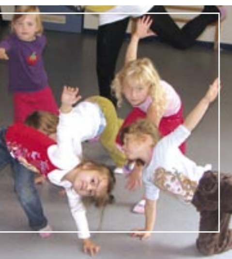
Kindertagesstätte Arche Noah

■ Puh! Ist das anstrengend! So klingt es nach der 45–60 minütigen Turnstunde aus Kindermund. Einmal pro Woche ist sie in altersgemischten Gruppen ein fester Bestandteil im Programm der Kindertagesstätte. Laufen, hüpfen, klettern, springen, balancieren – alltäglich? Nein! So etwas ist in unseren Wohnungen nicht gern gesehen. Auf dem Hof und auf der Straße auch nicht. Wo denn dann? Natürlich in der Kindertagesstätte. Unsere Erfahrung zeigt: Wer sich nicht ausreichend bewegt und sich nicht austoben kann, der kann auch nicht konzentriert arbeiten. Deshalb legen wir besonderen Wert auf die unterschiedlichsten „Bewegungseinheiten“. Wir finden täglich Möglichkeiten: Bei uns lernen Kinder Fahrrad zu fahren, Rollschuh zu laufen, zu